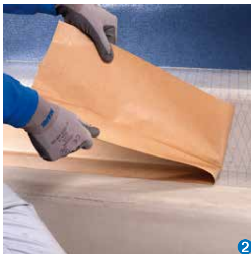
2 Odstranění ochranné vrstvy