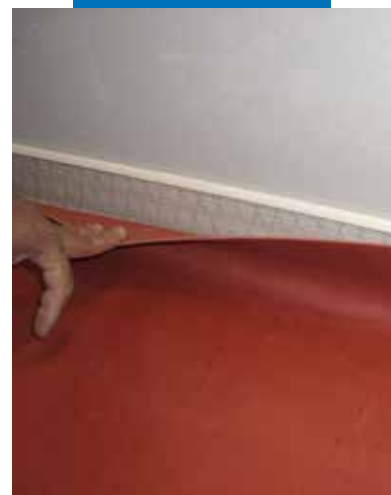
Zhotovení fabionu s použitím Mapecontactu