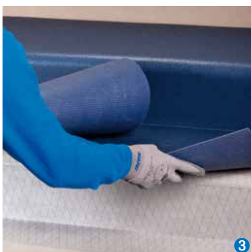
3 Instalace obvodové lišty z PVC s použitím Mapecontactu