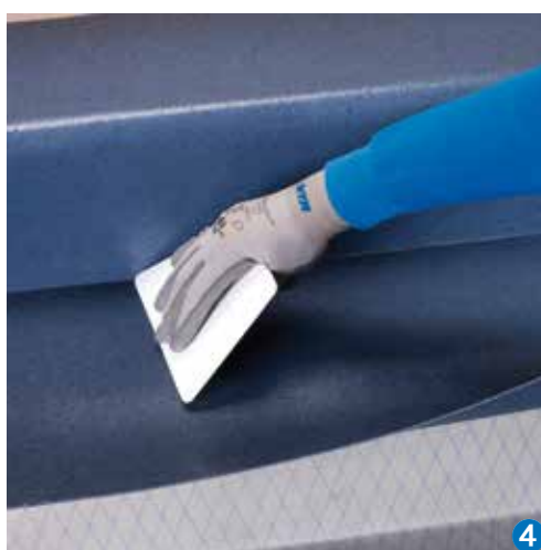
4 Zhotovení fabionu s použitím Mapecontactu