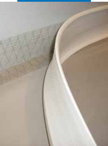
Instalace obvodové lišty z PVC s použitím Mapecontactu